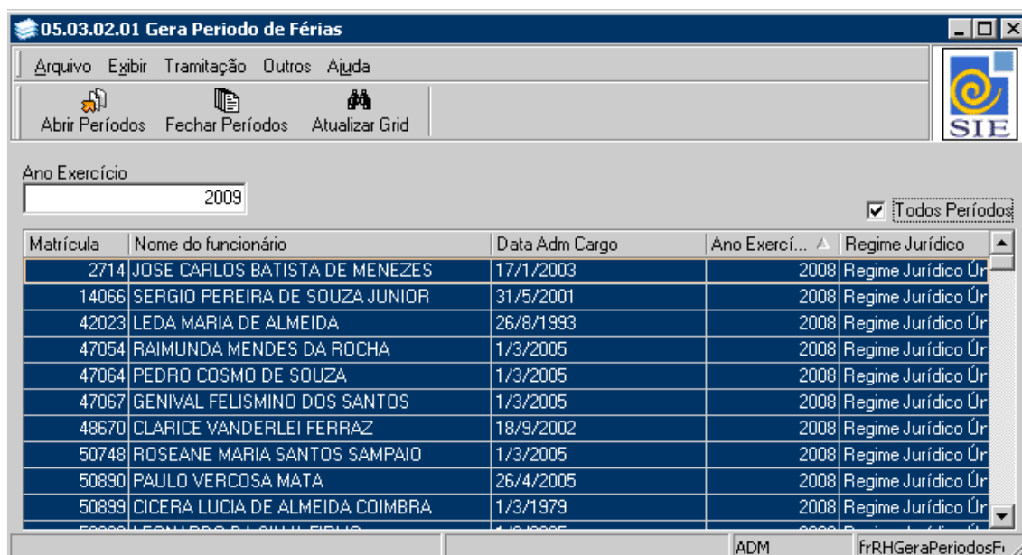
Figura 2: Tela Geração de Novos Períodos.

Neste exemplo, serão gerados os exercícios até o ano de 2009.